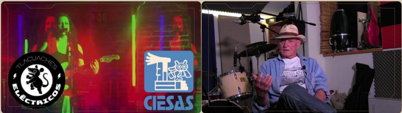
Tere Estrada y León Chávez Teixeira, fotogramas de la cápsula 2. Música disruptiva y feminismo.

Cápsula 10. Música disruptiva y represión.